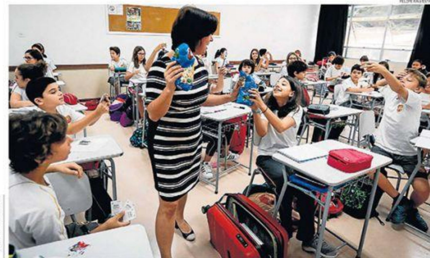
Exercício. Alunos do 6º ano do Colégio Pio XII fazem sua primeira atividade em um projeto de educação financeira

No ano passado, coordenadores do Fundamental 2 resolveram introduzir o tema, de maneira interdisciplinar, com o suporte a BNCC. "A gente queria